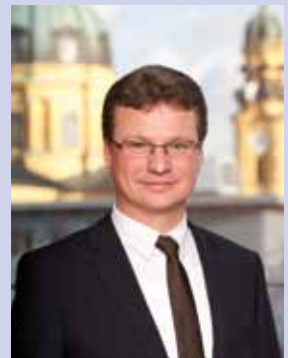
Bernd Sibler Staatssekretär im Bayerischen Staatsministerium für Unterricht und Kultus