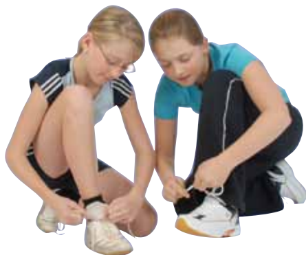
Ideal für den Sportunterricht: Universal-Hallen-Sportschuh (Schulsportschuh)

Sportschuhe, die man im Sportunterricht in der Halle trägt, sollen nicht auf der Straße getragen werden. Sie bringen sonst Schmutz in die Sporthalle, erhöhen dadurch das Unfallrisiko (Rutschgefahr) und die Gefahr der Verbreitung von Krankheitserregern. Wird der Hallensportschuh im Freien benützt, ist vor der weiteren Nutzung in der Sporthalle eine gründliche Reinigung des Schuhs erforderlich.